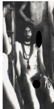
Gdy był hipisem

wicemarszałek Sejmu, przewodniczący klubu PiS