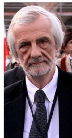
Gdy jest za PiS-em